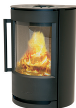
WIKING Luma 2