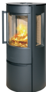
WIKING Luma 3