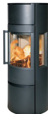
WIKING Luma 5