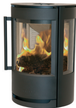
WIKING Luma 1