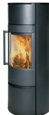
WIKING Luma 6