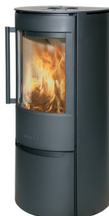
WIKING Luma 4