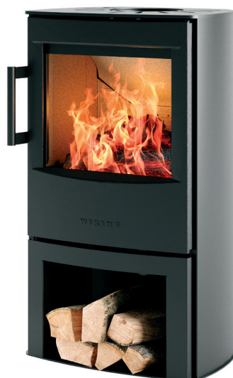
WIKING Mini 4