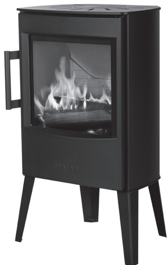
WIKING Mini 2