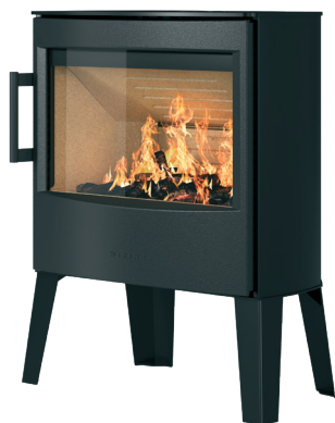
WIKING Maxi 2