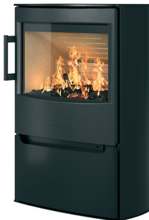
WIKING Maxi 4