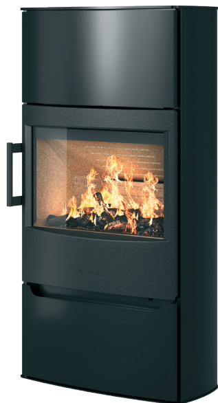
WIKING Maxi 6