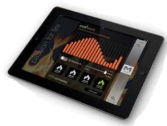
Ved sett H1